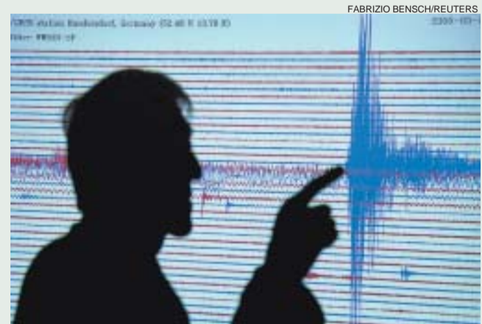
8,7 GRAUS - Tremor na Sumatra reacendeu medo de tsunamis