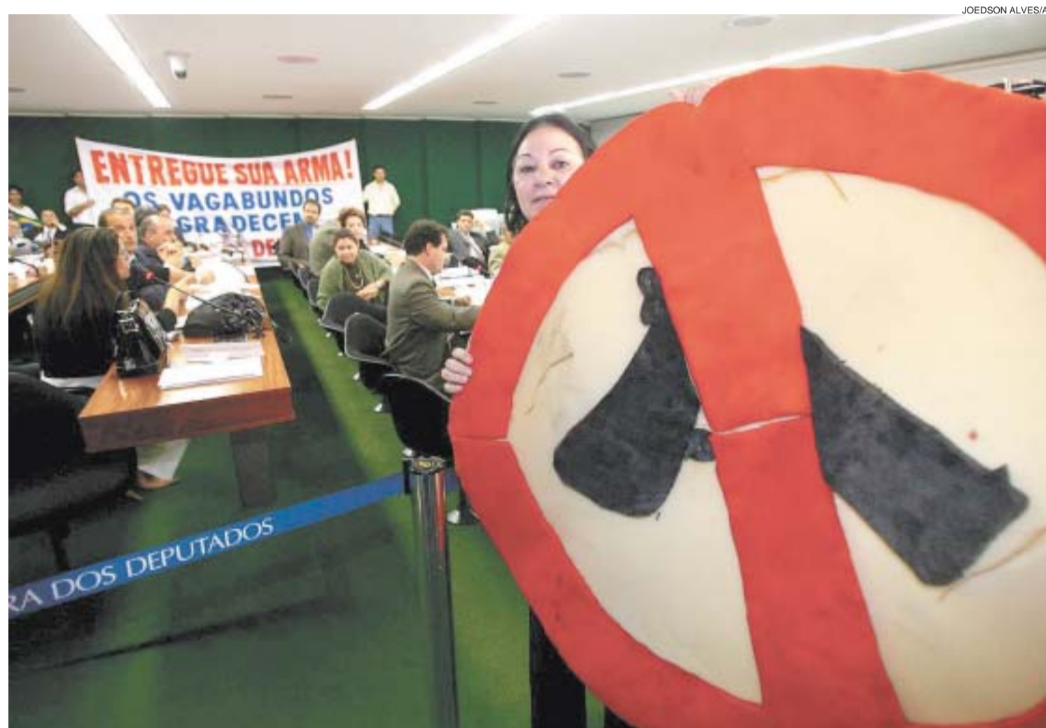
DISCUSSÃO ARMADA - Comissão de Segurança Pública da Câmara dos Deputados debate o desarmamento durante audiência